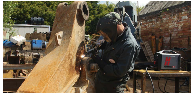
Onderhoud en reparatie